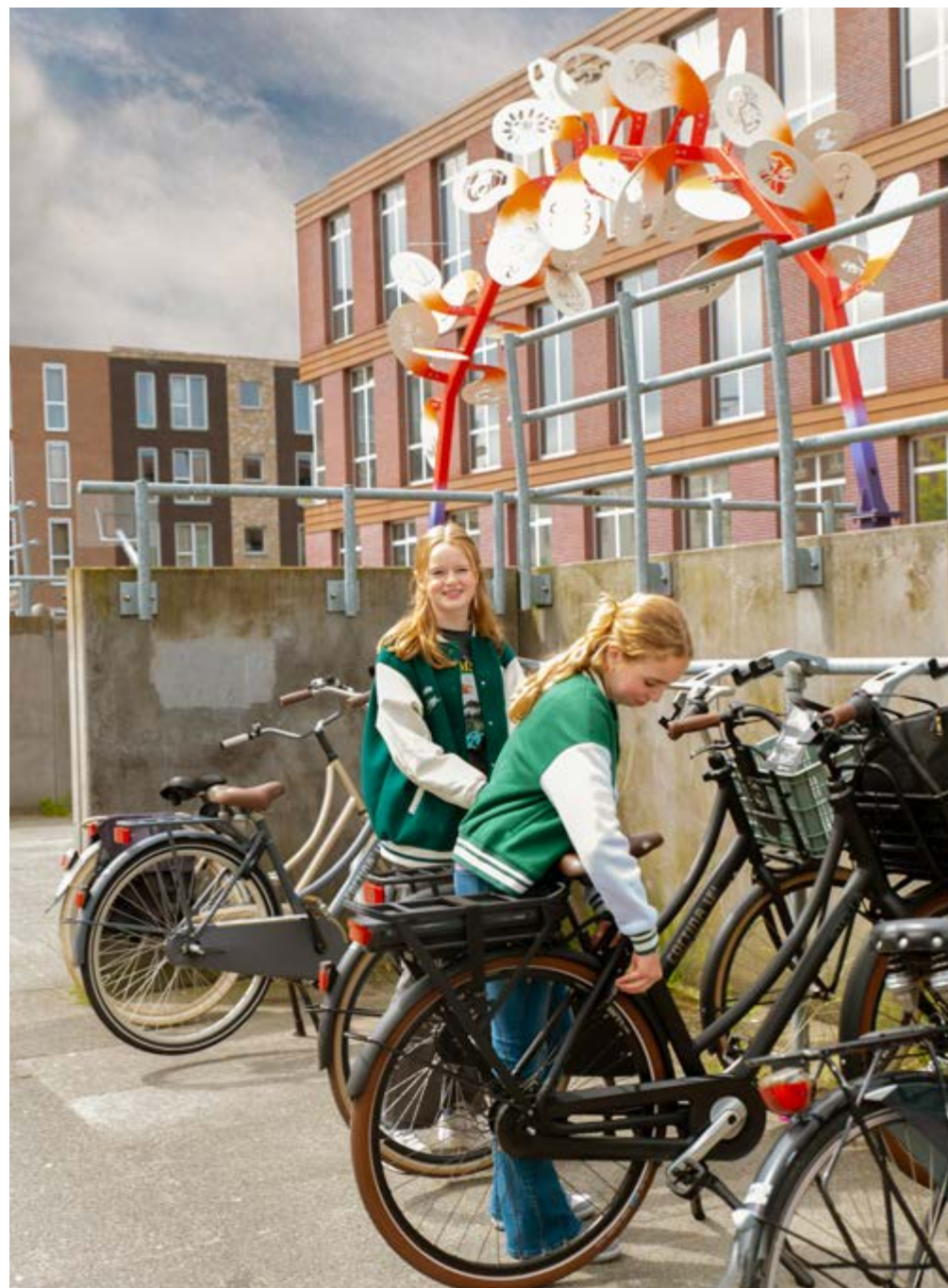
Leidend Principe 3: Op Arte heerst een positief en veilig leerklimaat